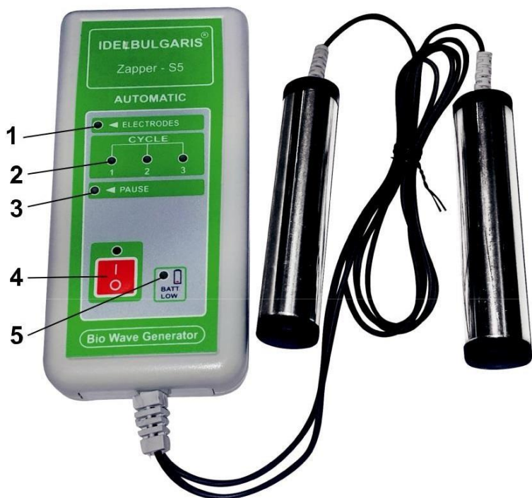
Fig. 9 placa frontală a dispozitivului

pe fig. 9 sunt afișate butoanele de comandă și indicație